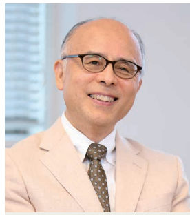
もりもり 森本あんり学長 1979年国際基督教大学人文科学科卒業。82年東京神学大学院組織神学修士課程修了。91年プリンストン神学大学院博士課程修了。専門は組織神学。国際基督教大学教授、同大学学務副学長などを経て2022年より東京女子大学学長。『反知性主義 アメリカが生んだ「熱病」の正体』など著書多数。

リベラルアーツ教育を建学の精神として掲げながら、戦後の画一化、序列化された日本の大学システムの中で、東京女子大学自身がその意義を見失いかけていた、と森本学長は